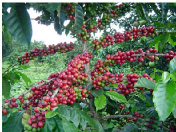
Potencial productivo del café catuai, bajo el sistema de producción cítrico y cobertura kudzú, maduración de frutos casi uniformes promedio de producción por planta 5 Kg. de guinda.