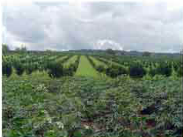
Diversificación de la parcela y asociación con kudzú (cobertura y abono verde), cítricos y café. Yuca (Izquierda)