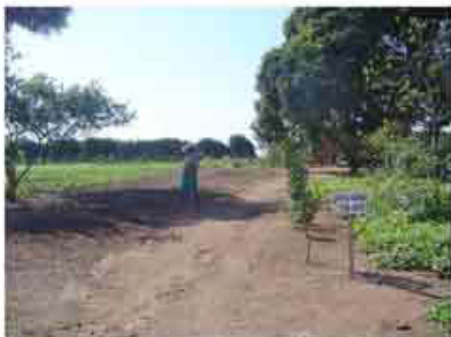
Entrada a mi vivienda y letrero de certificación UTZ-Kapeh