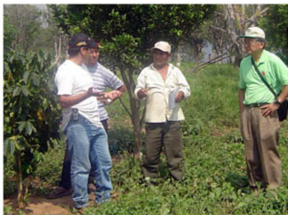
Visita e intercambio de experiencia con cooperantes japoneses y técnicos locales a mi unidad productiva