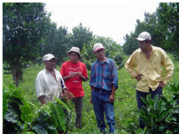
Visita de estudiantes de las universidad del país a mi escuela de campo (aprendizaje)