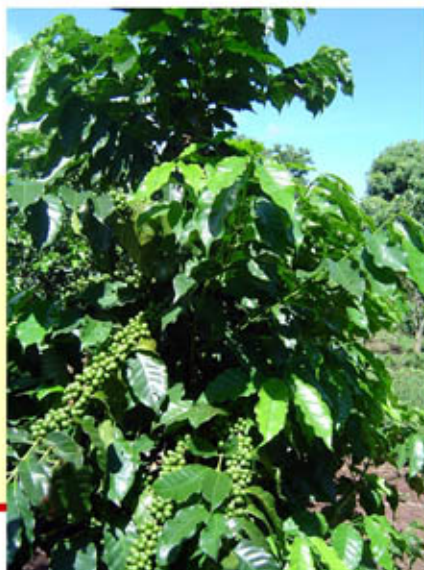
Izquierda brote de ramas vegetativas de café después de la poda de esqueletamiento y derecha planta de café con un lado en producción y el otro en desarrollo vegetativo para el siguiente año. Producción permanente y sostenida

Poda de rejuvenecimiento al 4to año de producción continua, pero con brote de un año de edad listo para la producción el mismo año de poda del tallo principal, producción continua del café hasta el cuarto ciclo (un ciclo dura 3 a 4 años)