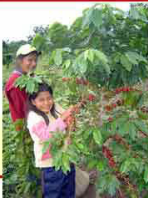
Mi segundo año de producción de café y cosecha del mismo con mi familia (hijas)