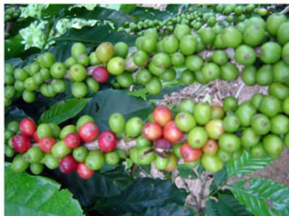
Potencial productiva del café en mi unidad productiva