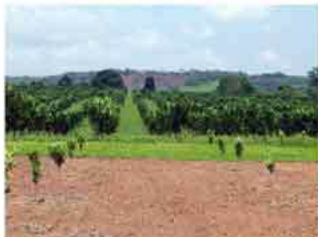
Mi unidad productiva familiar (sistema de producción)