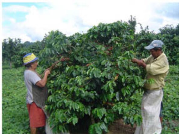
Cosecha del 3er año de producción plantas vigorosas izquierda y derecha potencial productiva